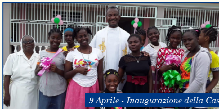
9 Aprile - Inaugurazione della Casa