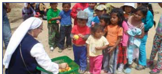
I bambini dell'Invasion