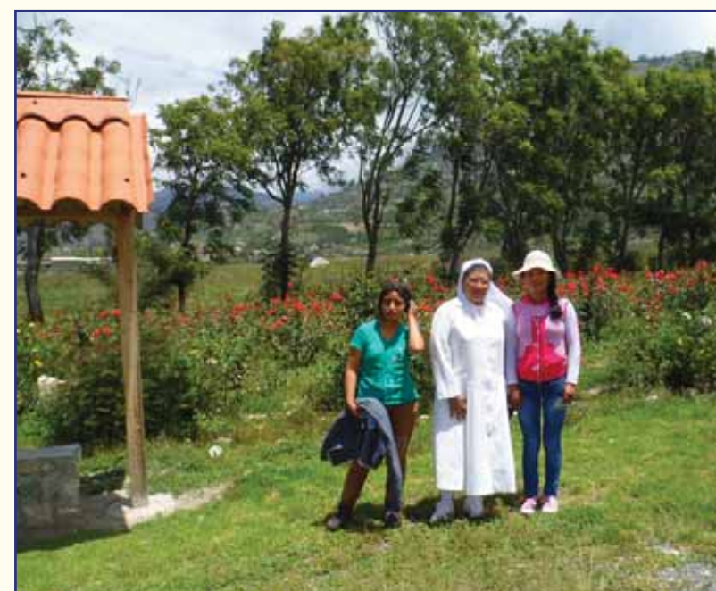
Il giardino della missione di Huaraz e la "Casa per Maggiorenni" in costruzione

in casa ciascuno ha i propri doveri quotidiani, come curare il giardino, riordinare ambienti, etc. Il progetto prevede anche l'avviamento al lavoro, che alcuni di loro già stanno svolgendo con serietà ed impegno. Nelle serate apprendono tutti in gruppo anche diversi lavori distensivi di manualità artistica."