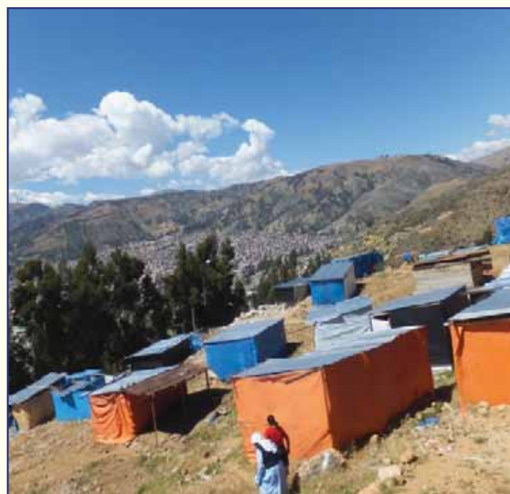
Baraccopoli di Chu Alto, detto "Invasion"

cerchiamo di occuparci proprio di quel tutto ma le risorse non sono mai sufficienti. Queste persone all'inizio pensavano di essere state abbandonate anche da Dio, ora ci attendono e NOI CON LORO abbiamo capito che è solo facendo e costruendo insieme che essi possono ritrovare una vera dignità umana e sentirsi persone inserite in una società: li aiutiamo così a sentirsi parte di una stessa famiglia."